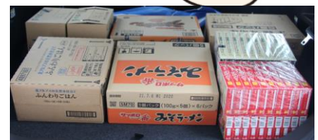
写真上[届けた食料品]