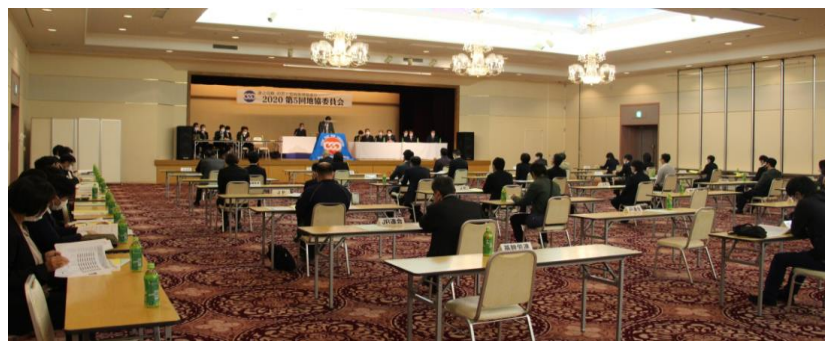
コロナ感染症防止対策として席の間隔を広くして開催！