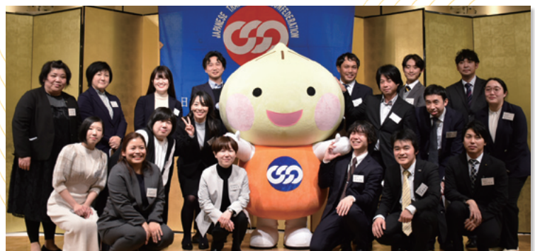
実行委員の皆さんと、ユニオニオン