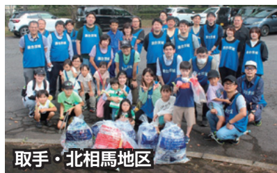
取手・北相馬地区