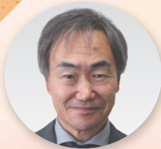
労働相談アドバイザー