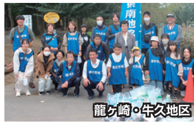
龍ヶ崎・牛久地区