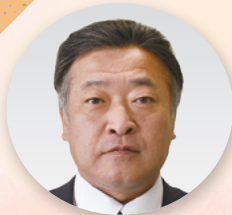
部長 [組織拡大 オルガナイザー]