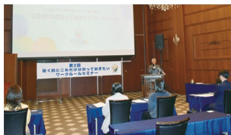
土浦会場（11月30日・ローブ）