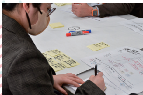
機関紙作成の課題洗い出し

手段（広報活動）が目的にならないように、組織の活動の「目的」をより明確に、そして目的達成に必要な目標を置いた活動の進め方の大切さを学びました。