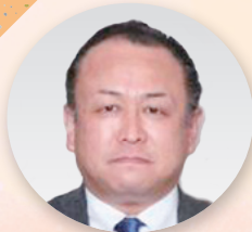
副事務局長 [組織部、 広報教育部]