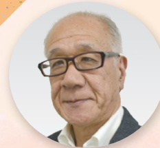
労働相談アドバイザー