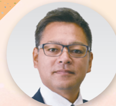
副事務局長 [政治センター、 政策調査部]

自身を磨き、働くすべての皆さまに頼られる組織への更なる成長に寄与できるよう努力します。体は成長しないよう気を付けますm(_ _)m