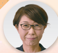
副部長 [組織部、 広報教育部]