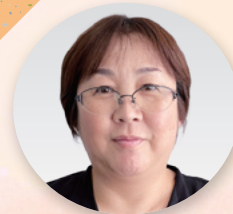
副事務局長 [労働部、 男女平等推進室]