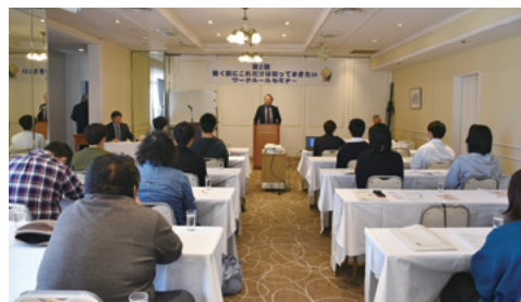
水戸会場（11月23日・水戸京成ホテル）

今後も、将来を担う若い皆さんの社会生活の支援をめざす取り組みとして、学校での出前講義も要請しつつ、継続した取り組みを展開していきます。