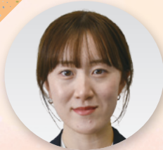
書記 [男女平等推進室、 広報教育部]

働く上で困ったときに頼ってもらえるよう「連合茨城」の広報周知の強化。この機関紙も皆さんの記憶に残るよう工夫します！