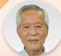
労働相談アドバイザー