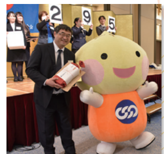
お楽しみ抽選会の様子