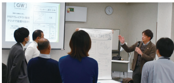
グループで作上げた機関紙を発表