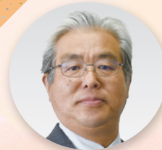
部長 [政治センター、 メーデー、平和行動]