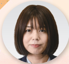
副部長 [総務財政、 労働部]

街宣行動、メーデー等を通じて、連合茨城をもっと知ってもらえるよう頑張ります。家庭では、ピザ窯を作ります。