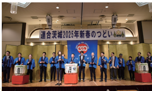
堂込参議院議員による乾杯