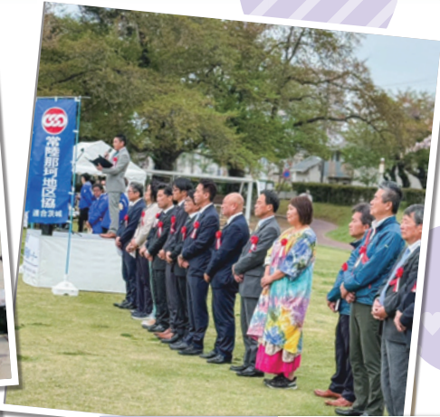
常陸那珂地区 4月20日㊥