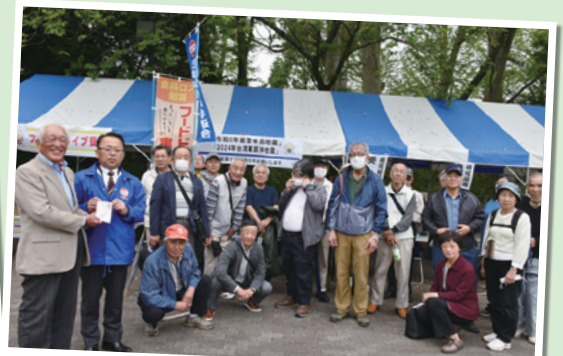
支援募金活動 (県退連より寄付)