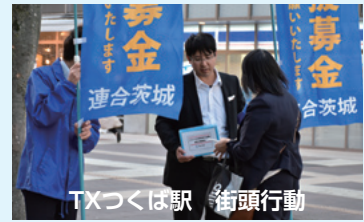
TXつくば駅 街頭行動

お預かりしたカンパ金は、連合本部を通じて被災地各県へ復旧・復興への「義援金」として送らせていただきました。