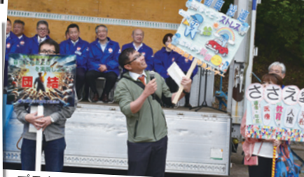
プラカードコンテスト (最優秀賞: 自動車総連)