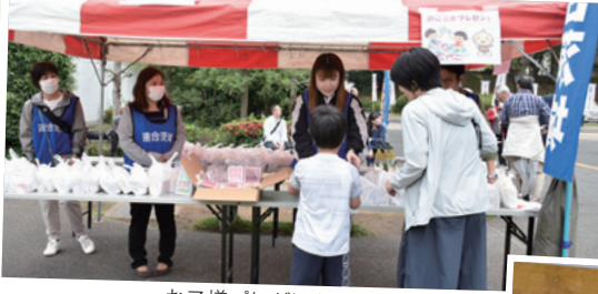
お子様プレゼントコーナー