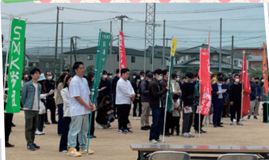
高萩・北茨城地区 4月20日㊥